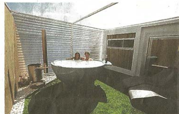
... als buiten genieten van een verkwikkend bad.